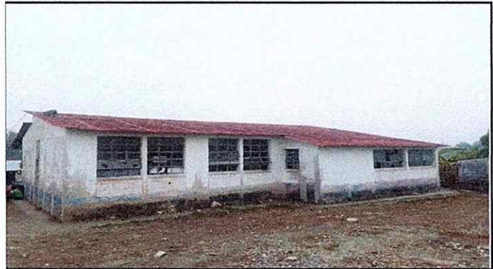
Cambio de Vidrios para Ventanas