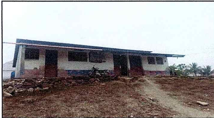
Pintura Interior Y exterior