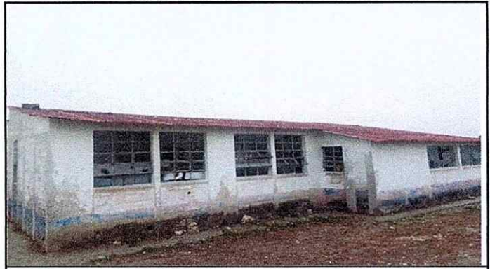
Cambio de Techo de Aula