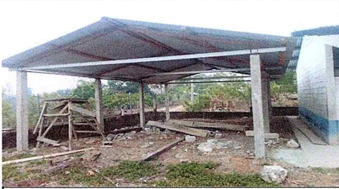
Colcacion de Piso para Cocina